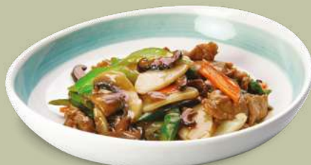
GNOCCHI DI RISO CON MANZO 6,00€ Manzo, carote, verza, broccoli, funghi champignon, cetrioli