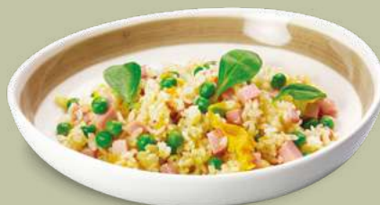
RISO ALLA CANTONESE 5,50€ Prosciutto cotto, piselli, uova