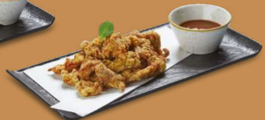
POLLO ALLA COREANA 5,50€ Straccetti di pollo marinati e fritti in stile coreano