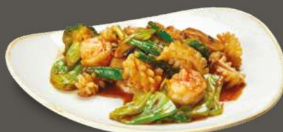
GAMBERI E CALAMARI SHŪ CÀI 8,00€ Gamberi, calamari, funghi champignon, verza, broccoli, cetrioli, carote