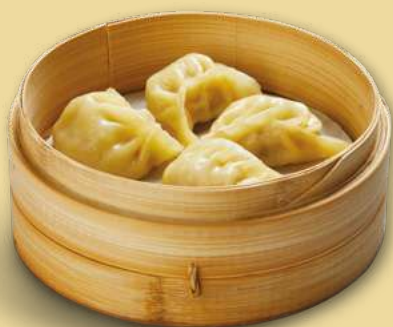
JIǎO ZI 4,50€ Ravioli di carne al vapore