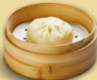
BĀO ZI 3,00€ Panino cinese ripieno di carne