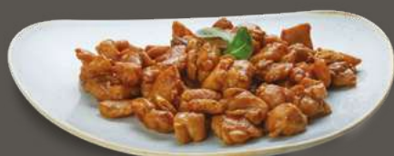
POLLO ALLE MANDORLE 6,00€ Pollo, mandorle caramellate