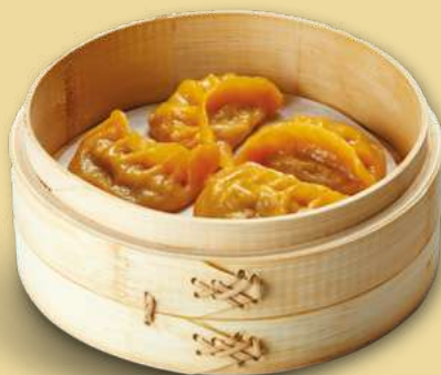
NÍU RÒU JIǎO 5,00€ Ravioli allo zafferano con carne di manzo