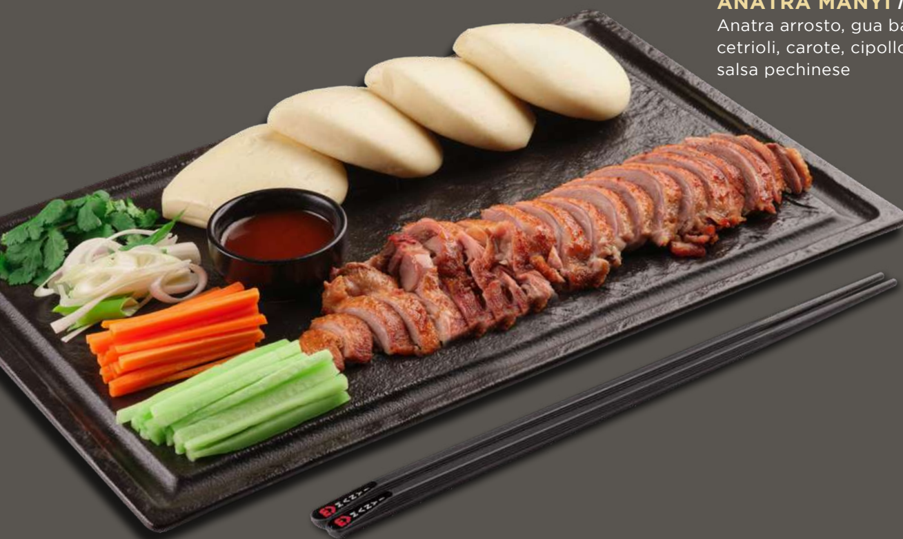
ANATRA MANYI 15,00€ Anatra arrosto, gua bao(4pz), cetrioli, carote, cipollotti, salsa pechinese