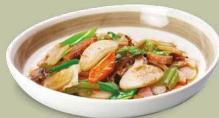
GNOCCHI DI RISO CON ANATRA 6,00€ Anatra, carote, verza, broccoli, funghi champignon, cetrioli