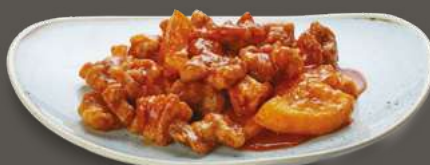
POLLO ALL'ARANCIA 6,00€ Pollo, salsa agli agrumi, arancia a spicchi