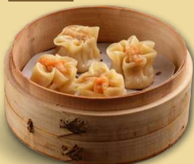
SHĀO MÀI 5,50€ Ravioli di gamberi* (presenza di carne)