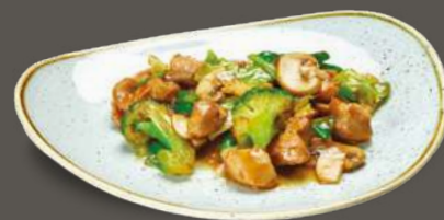
POLLO SHŪ CÀI 6,00€ Pollo, funghi champignon, verza, broccoli, cetrioli, carote