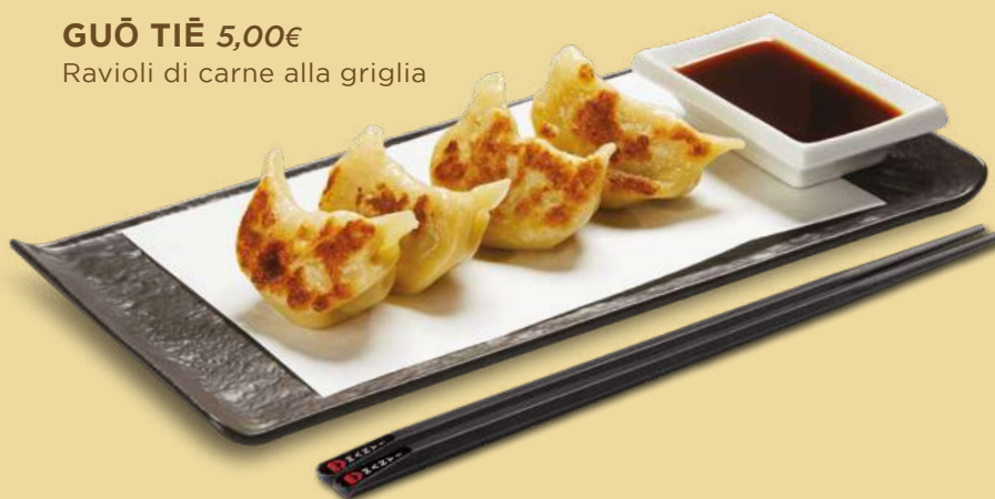
GUŌ TIĒ 5,00€ Ravioli di carne alla griglia