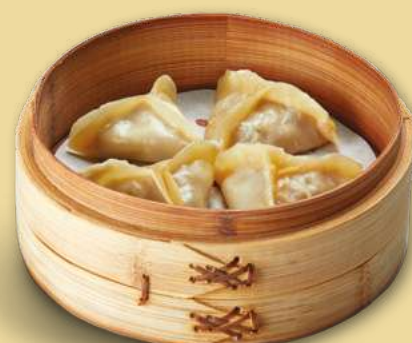
MÉI CÀI JIǎO 5,50€ Ravioli di pancetta con meicai