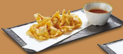
WON TON FRITTO 4,50€ Carne, cipollotti