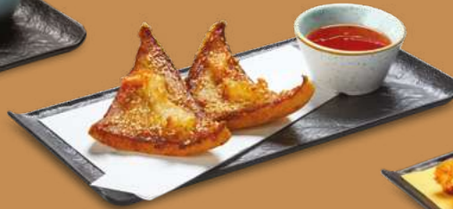
TOAST DI GAMBERI 4,50€ Pollo macinato, gamberi, sesamo