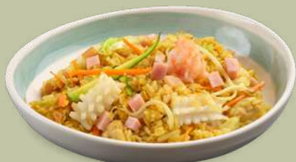
RISO SINGAPORE 6,00€ Uova, gamberi, calamari, prosciutto cotto, pollo, carote, zucchine, germogli di soia, cavolo cinese, curry