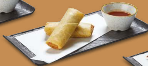
INVOLTINI PRIMAVERA 4,00€ Mix di verdure, macinato di maiale