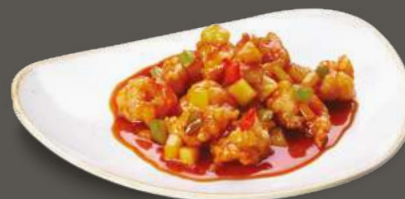
GAMBERI IN AGRODOLCE 8,00€ Gamberi fritti in pastella, peperoni, ananas, salsa agrodolce