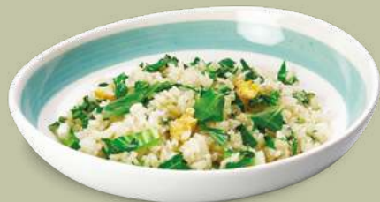
RISO CON VERDURE 4,50€ Cavolo pak-choi, uova