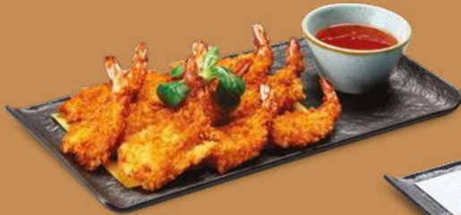
GAMBERI FRITTI* 7,50€ Gamberi marinati, panatura di panko