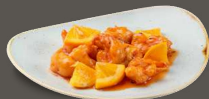
GAMBERI ALL'ARANCIA 8,00€ Gamberi fritti in pastella, salsa agli agrumi, arancia a spicchi