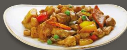
POLLO AL CURRY 6,00€ Pollo, patate, carote, cipolla, piselli, peperoni