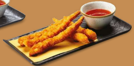
TEMPURA DI GAMBERI* 5,50€ Code di mazzancolle in tempura