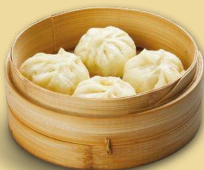
XIǎO LÓNG BĀO 4,50€ Xiao Long Bao di carne