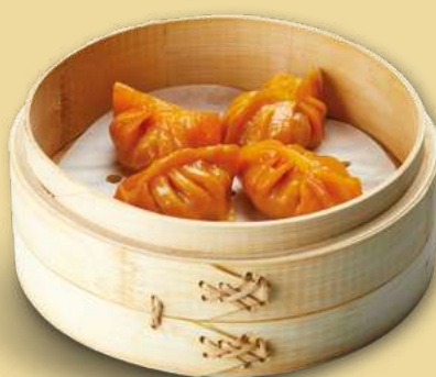
JĪ RÒU JIǎO 4,50€ Ravioli di pollo al pomodoro