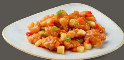
POLLO IN AGRODOLCE 6,00€ Pollo fritto in pastella, ananas, peperoni, salsa agrodolce

Pollo 鸡肉 Gamberi 虾仁 Anatra 鸭肉 Manzo 牛肉 Maiale 猪肉